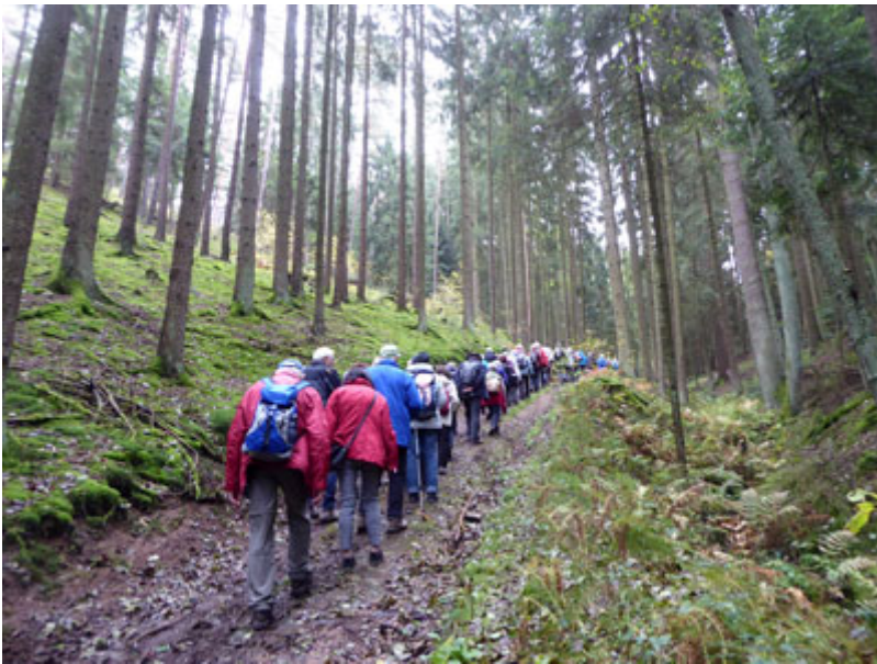
Auf der Anhöhe von Schneitweg war auch eine kleine Trinkpause drin.